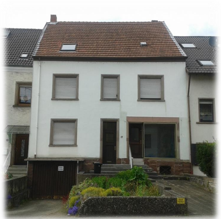
Oberdorfstraße 27, 2019

Nach dem Tod der Mutter, verkaufte der Sohn, Wolfgang Bruckmann das Anwesen.