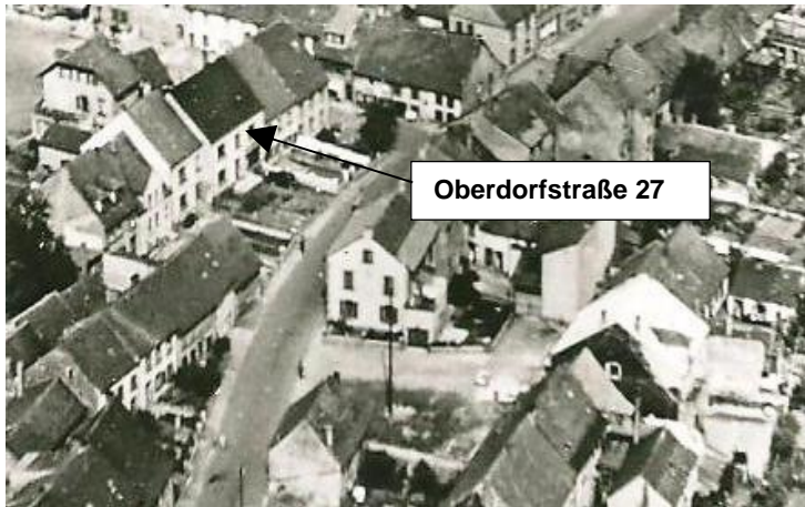
Luftaufnahmeausschnitt von Kleinblittersdorf um 1953, Oberdorfstraße