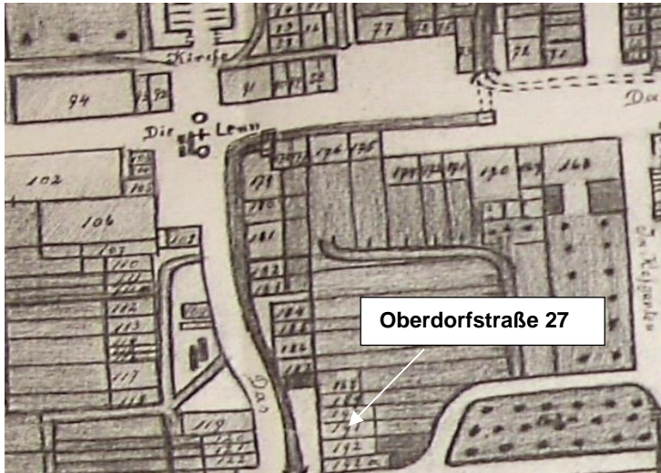
Ortsplan von Karl Brettar, „ Kleinblittersdorf um 1900 “