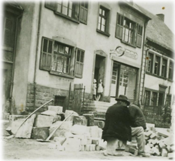
Oberdorfstraße 27 um 1950