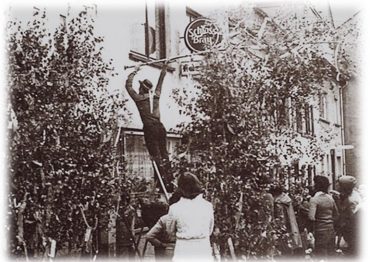
Maibaumsetzung an der Gaststätte „Kindchesbrunnen“