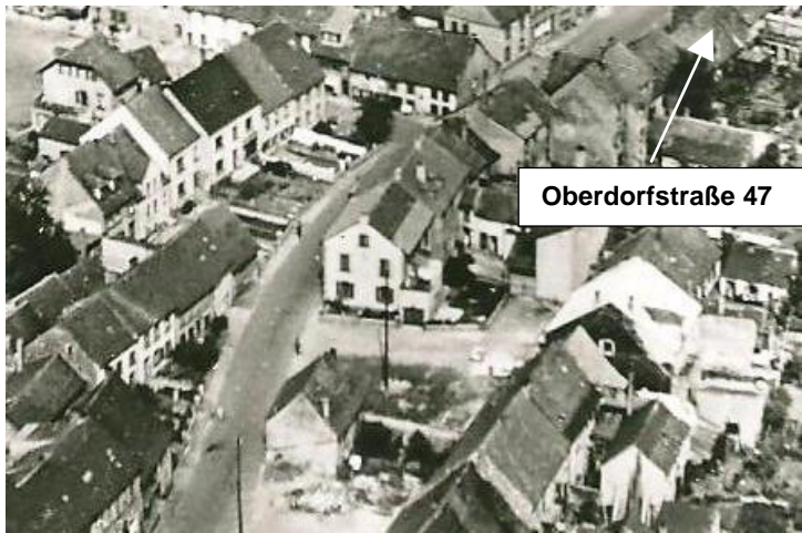
Luftaufnahmeausschnitt von Kleinblittersdorf um 1953, Oberdorfstraße