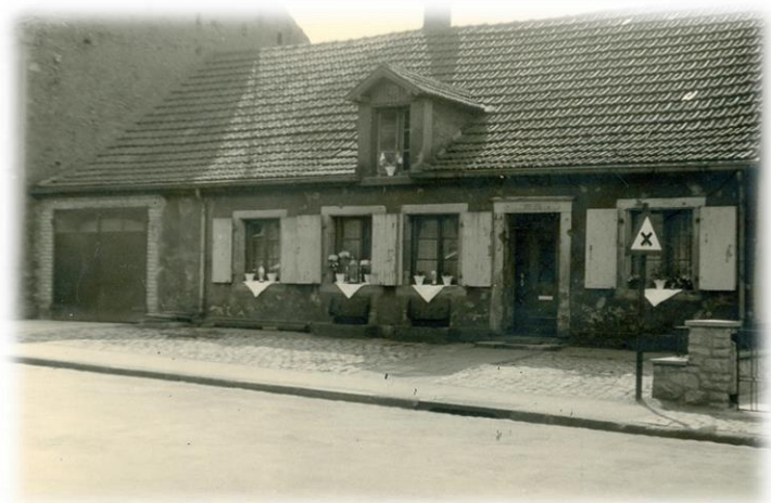
Oberdorfstraße 47, Fronleichnam 1956