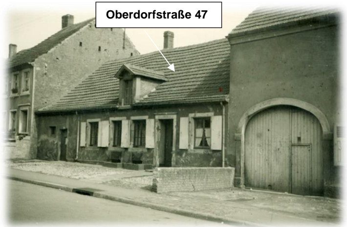
Oberdorfstraße 1950, v.l.n.r.: Haus 49, 47 u. 45.