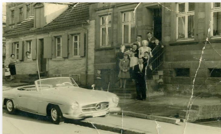
v.l.n.r.: Oberdorfstraße 52 und 51, 1954