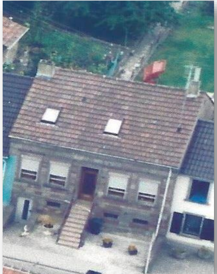
Luftaufnahme Oberdorfstraße 51