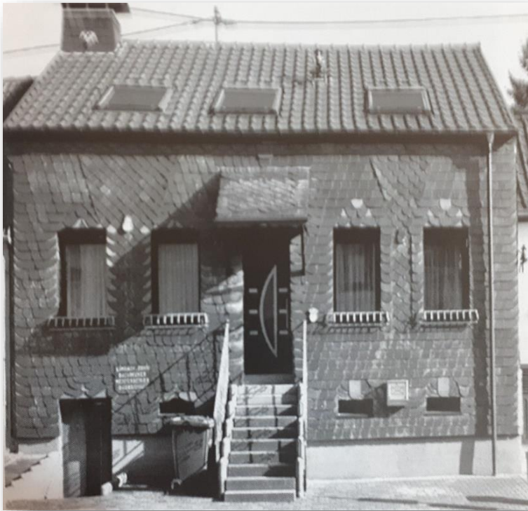
Die gesamte Sandsteinfront des Hauses wurde vor einigen Jahren mit schwarzen Schieferplatten verkleidet...“