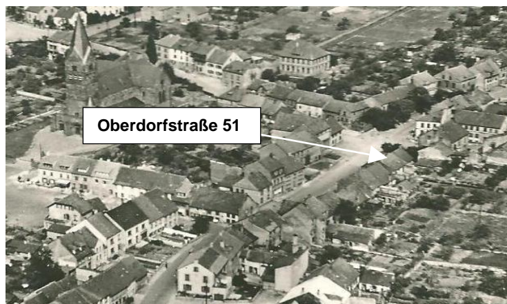
Luftaufnahmeausschnitt von Kleinblittersdorf um 1953, Oberdorfstraße