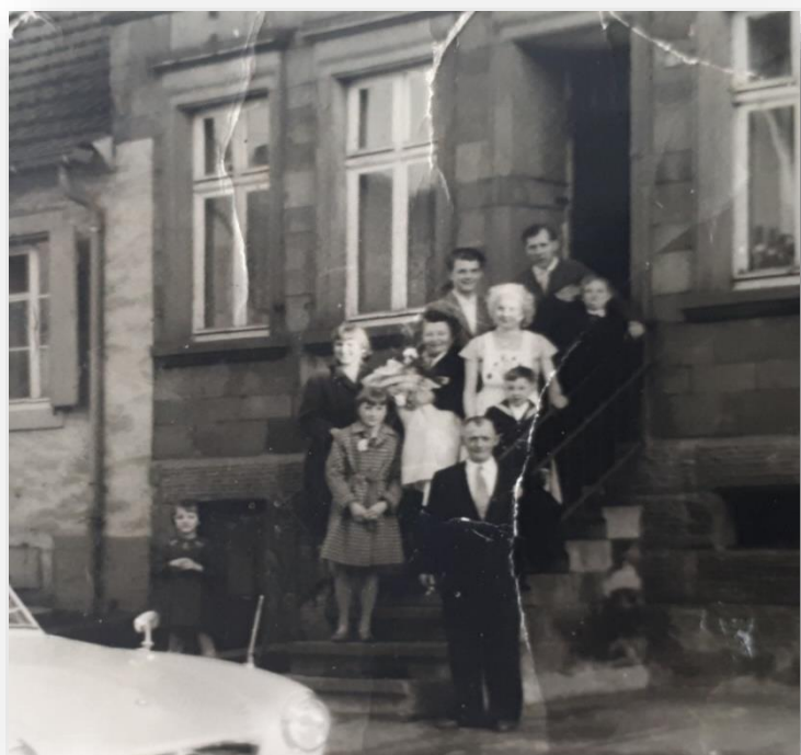
Oberdorfstraße 51, 1954