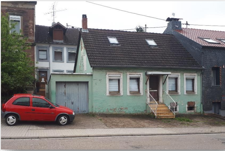
Oberdorfstraße 52, 2021