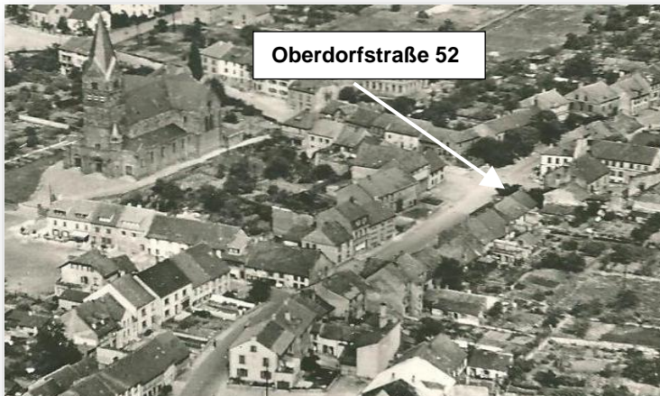
Luftaufnahmeausschnitt von Kleinblittersdorf um 1953, Oberdorfstraße